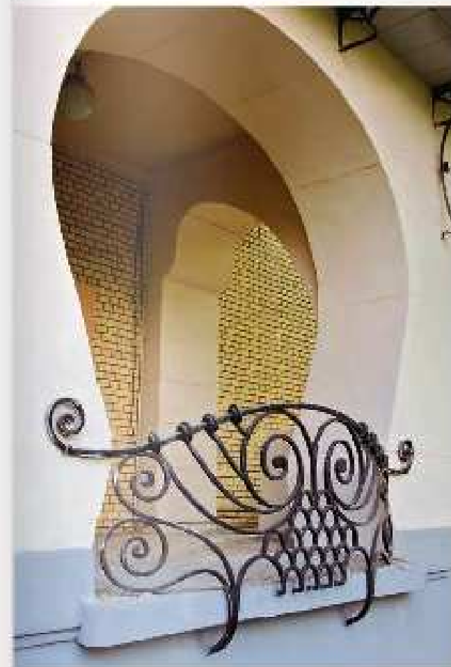
Особняк С.П. Рябушинского. Фрагмент