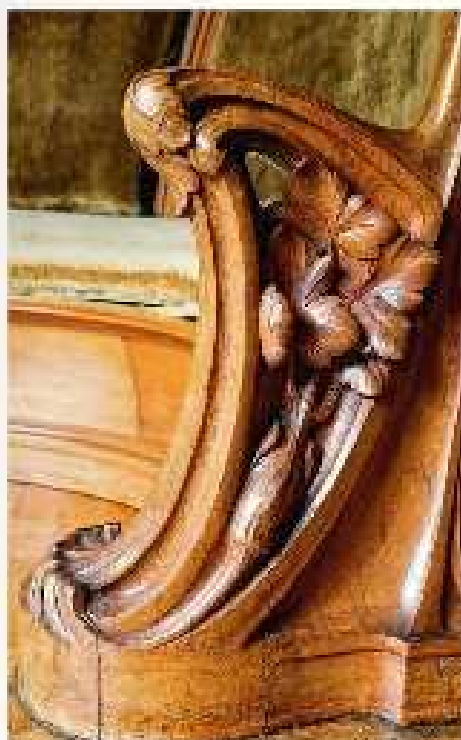
Стенд в стиле либерти от «Дизайн-студии Анны Куликовой и Павла Миронова» на мебельной выставке «Милан-2014»

Основной мотив, «красная нить» и философия модерна – это подражание естественным природным формам, легкость и воздушность силуэтов. Его главные черты – символичность, декоративность, асимметрия и сложные растительные орнаменты. Важнейший узор – изогнутая линия, напоминающая то ли ветвь лианы, то ли локон волос. Оформляя интерьер в стиле модерна, дизайнеры отдают предпочтение тающим, гибким формам – этот прием способен превратить, например, кожаную креслу или перила лестницы в причудливые «фрукты» фантастических растений и экзотических цветов. Очень популярны здесь замысловатые цветные витражи. Богат и разнообразен материал: обязательное дерево соседствует с керамикой, стеклянной мозаикой, натуральным камнем, фарфором, бронзой и позолотой.