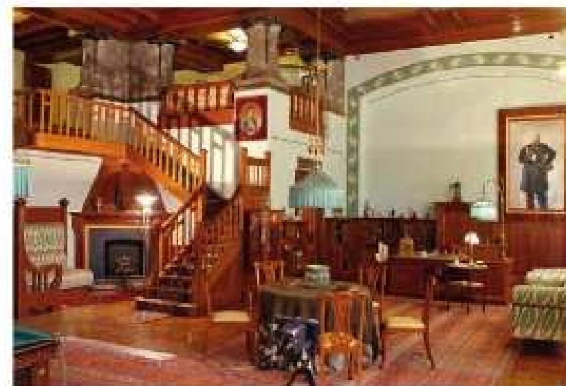
Парадный кабинет Николая II в Александровском дворце Царского Села

Конечно, сегодня перед дизайнером никто не ставит задачу в точности повторить интерьер царских особняков начала XX века. Но все равно современный интерьер в стиле модерн – дело довольно затратное. Дерево благородных пород, натуральный камень, наборный паркет – вот отделочные материалы, которые потребуются для создания такого интерьера. Стены украшаются гипсовыми фризами и деревянными панелями. И конечно, нельзя забывать о декоративных элементах. Тяжелая скатерть со стилизованным растительным рисунком, бронзовые или латунные паллы и канделябры, массивные торшеры с яркими абажурами, вазы из разноцветного стекла – интерьер в стиле модерн должен радовать глаз многообразием форм и красок.