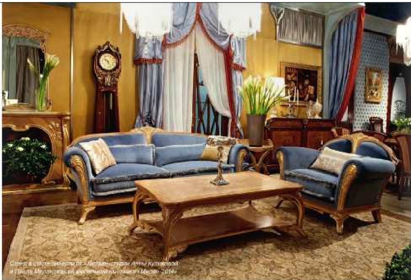
Салон в стиле модерн от студии дизайна интерьеров Almya Kulyarova и Дарья Шендерович. Москва, 2014.